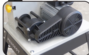
Système d'aspiration cyclonique intégré Dust wizard inside