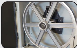
2 Volants fonte d'aluminium 305 mm 2x 305 mm cast aluminium wheels