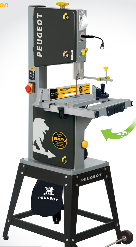
Table XXL XXL Table

Guide de coupe circulaire Circular cutting guide