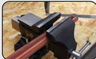
Mâchoires inférieures pour serrage de tubes Lower jaws for tube clamping