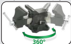
Base pivotante à 360° Swivel base at 360°