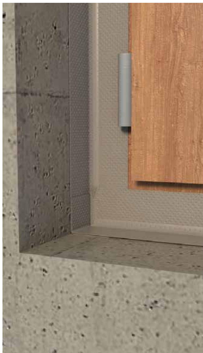
Calfeutrement par l'intérieur d'une menuiserie avec membrane TRAMIFLEX OPTIMA VARIO

Température d'utilisation : De +5°C à +35°C