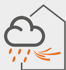
ÉTANCHÉITÉ À L'EAU ET À L'AIR