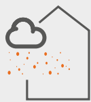
PERMÉABILITÉ VARIABLE À LA VAPEUR D'EAU