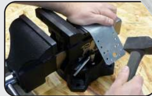
Enclume intégrée Integrated Anvil