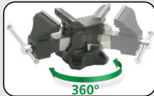
Base pivotante à 360° Swivel base at 360°