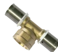
Té Femelle au centre