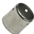
Bague pour raccord à sertir