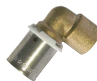
Coude à sertir et à souder - tube cuivre