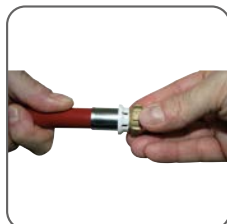
2 - Placer le raccord sur le tube en s'assurant qu'il soit bien positionné en butée (fenêtre de contrôle).