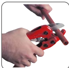
1 - Couper le tube proprement.