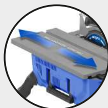
• Table sur glissière Sliding table