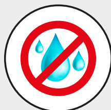
Coupe sans eau Waterless cutting