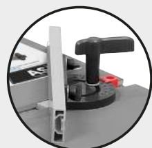
Guide d'angle Angle guide