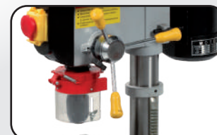
Cabestan droitier ou gaucher Right or left hand system