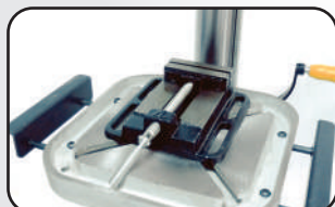
Extensions de table Table extensions