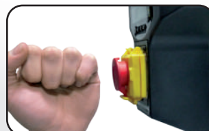
Arrêt coup de poing Punch mechanical NVR switch