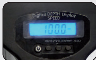
Affichage numérique vitesse / profondeur Speed / depth digital screen