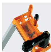
Porte-outils et support perceuse, visseuse...