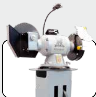
Exemple de montage de touret Bench grinder mounting example