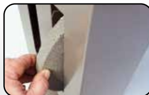
Range meules intégré Wheels holder