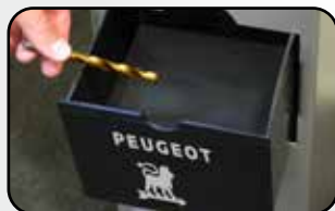
Tiroir à liquide Drawer for liquid