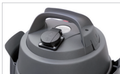
Prise asservie Slave power socket