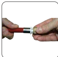
2 - Placer le raccord sur le tube en s'assurant qu'il soit bien positionné en butée (fenêtre de contrôle).