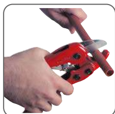
1 - Couper le tube proprement.