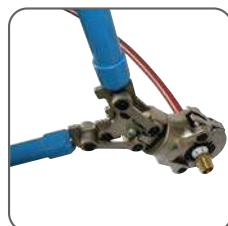
3 - Placer la pince à sertir au niveau de la bague et actionner les leviers.