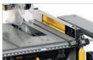
Guide parallèle traversant à fixation rapide Crossing parallel guide with quick fixing