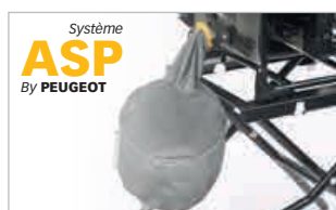
Système ASP By PEUGEOT Sac d'aspiration des poussières intégré(14L) Integrated dust suction (14L)