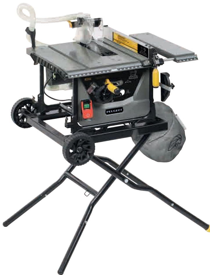
Table sizes : 455x488 mm