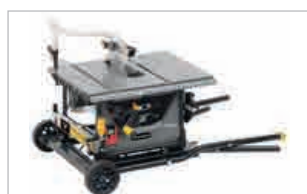
Pliante : transport facile Foldable : easy transportation