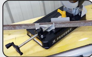
Etau réglable 45° Vise setting 45°