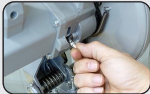
Blocage de l'arbre du disque Disc spindle locking