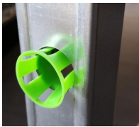
PASS-RING - vue en situation