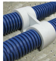
FIX-RING Double - vue en situation