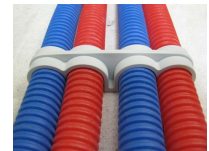
FIX-RING Quadruple - vue en situation