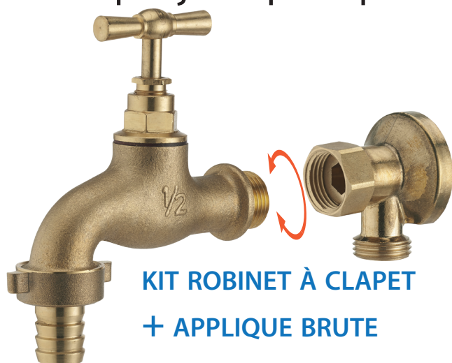
KIT ROBINET À CLAPET + APPLIQUE BRUTE