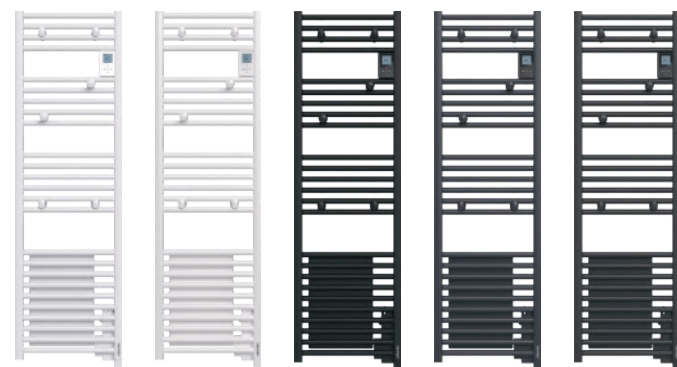
BLANC BRILLANT BLANC CARAT NOIR GRAPHITE ANTHRACITE