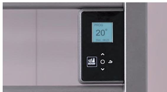
Boîtier digital tactile et programmable