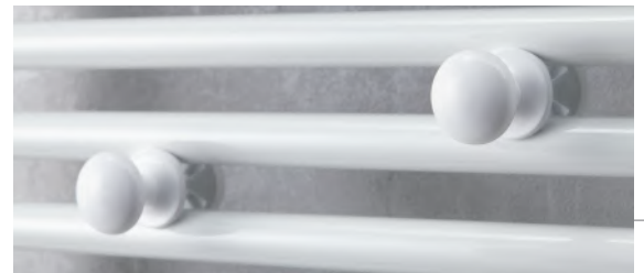
2 patères boutons amovibles