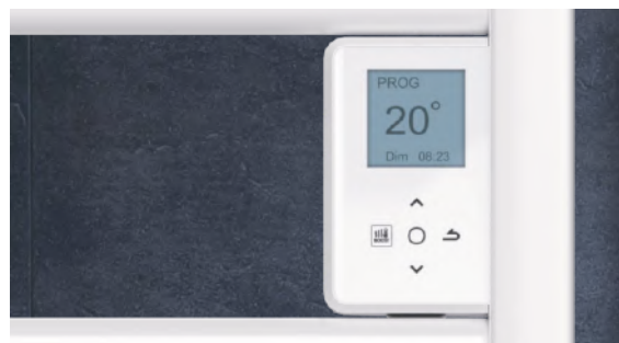
Boîtier digital tactile et programmable