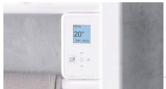
Boîtier digital tactile et programmable