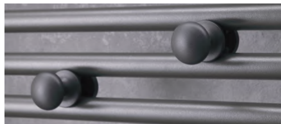
2 patères boutons amovibles