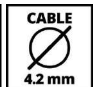
CABLE 4.2 mm