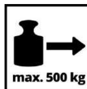
max. 500 kg