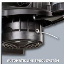
AUTOMATIC LINE SPOOL SYSTEM