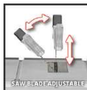
SAW BLADE ADJUSTABLE