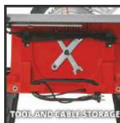
TOOL AND CABLE STORAGE